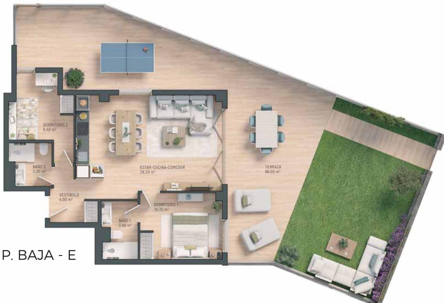
P. BAJA - E